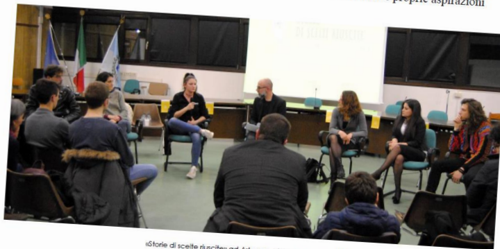
Storie di scelte riuscite ad Artegna, giovedì 21 marzo 2019

Si conclude il ciclo di incontri promosso da Comune di Trasaghis, Associazione MEC e Rete «B*sogno d'esserci» per valorizzare le «scelte riuscite» di giovani del territorio e stimolare altri giovani a riconoscere le proprie capacità e realizzare le proprie aspirazioni