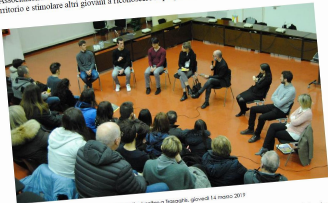
Storie di scelte riuscite a Trasaghis, giovedì 14 marzo 2019

Dopo la serata d'apertura a Trasaghis, prosegue il ciclo di incontri promosso da Comune di Trasaghis, Associazione MEC e Rete «B*sogno d'esserci» per valorizzare le «scelte riuscite» di giovani del territorio e stimolare altri giovani a riconoscere le proprie capacità e realizzare le proprie aspirazioni