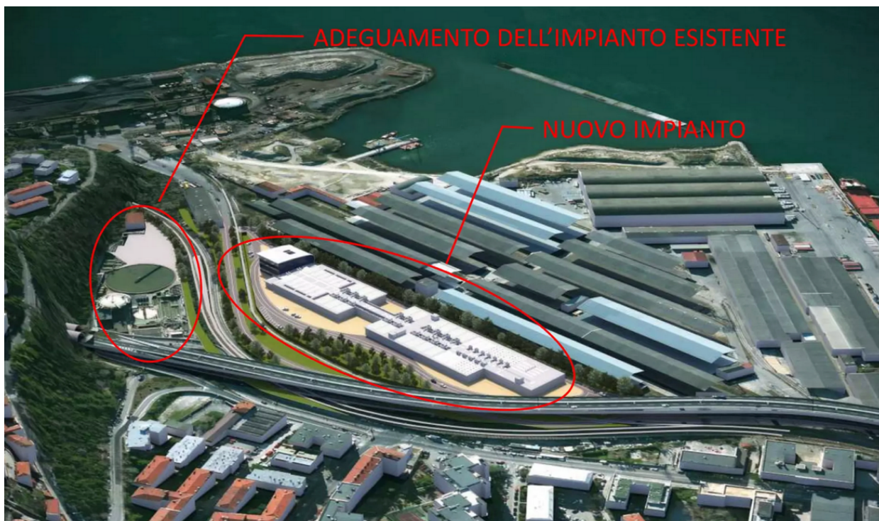
Figura 1. Aree interessate dall'adeguamento dell'impianto di depurazione (rendering)

Quadro, anche la bonifica dell'area Scalo Legnami. Nell'area definita per l'ampliamento insistono infatti restrizioni quali la presenza di due linee ferroviarie, la vicinanza alla Piattaforma Logistica prevista dall'Autorità Portuale, lo sviluppo dell'area di ampliamento relativa al torrente Baiamonti, l'esistenza di fasce di rispetto degli edifici residenziali esistenti, della ferrovia, dei piloni di sostegno della viabilità, la presenza di capannoni dello Scalo Legnami (con coperture in eternit) e delle relative infrastrutture.