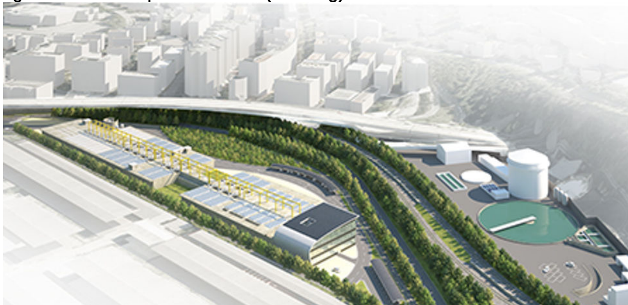
Figura 3. Area dell'impianto di Servola (rendering)

Non spetta in effetti a questa relazione dare un giudizio sull'opportunità o sul costo dell'operazione intrapresa, in quanto l'intervento è stato "obbligato" dalla necessità di rispettare le normative esistenti e di intraprendere un percorso di uscita dalla procedura di infrazione.